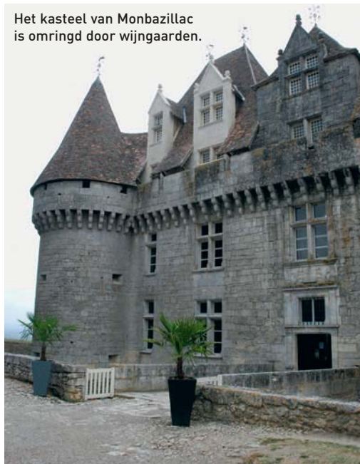
Het kasteel van Monbazillac is omringd door wijngaarden.