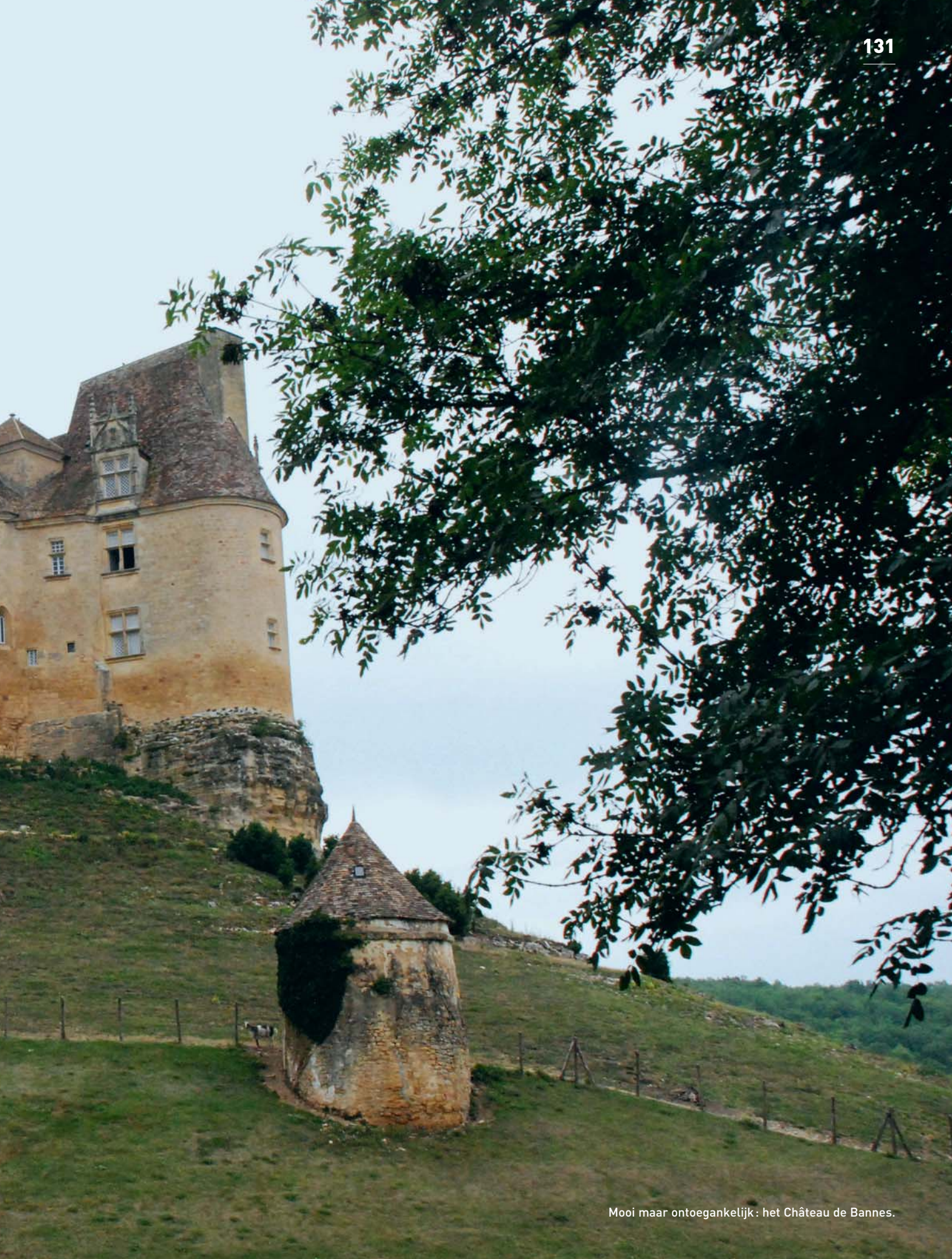
Mooi maar ontoegankelijk: het Château de Bannes.