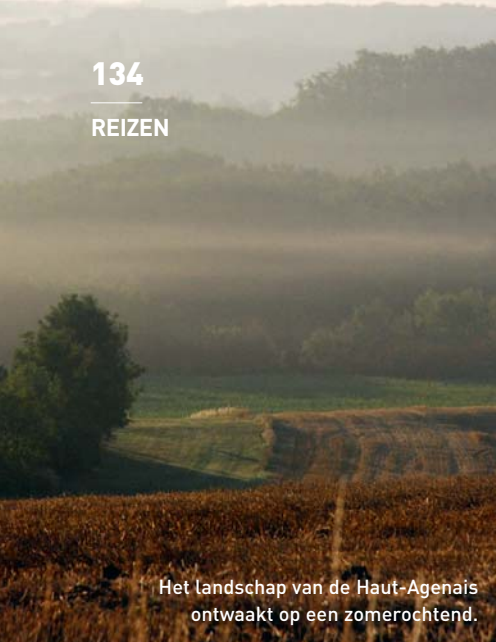
Het landschap van de Haut-Agèhais ontwaakt op een zomerochtend.