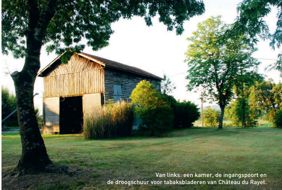
Van links: een kamer, de ingangspoort en de droogschuur voor tabaksbladeren van Château du Rayet.

bekende vader. Het berooide gezin kan zich niet veel permitteren, zodat het meisje al jong uit werken moet gaan. Dat valt niet mee in het racistische zuiden, maar de kleine Joséphine werpt zich tussendoor op haar passie voor het dansen en verdient op haar veertiende haar eerste zakgeld bij het Booker Washington Theater. Al snel wordt ze opgemerkt en door een Amerikaanse uit Parijs naar de Franse hoofdstad uitgenodigd voor de Revue Nègre in een theater op de Champs Elysées. Ze is pas negentien en zet meteen al haar troeven in. Als ze gaat dansen in een pak dat enkel uit roze pluimen bestaat, is Parijs te klein. Twee jaar later verovert ze alle harten als ze in de Folies Bergères optreedt met enkel een ceintuur van bananen. Uiteindelijk richt ze haar eigen cabaret op en wordt door de grootste couturiers gekleed. Ze verdient veel geld en geeft veel geld uit, en als ze in Milandes langskomt, is ze meteen verliefd en huurt ze het kasteel. Tien jaar later, in 1947, koopt ze het hele complex en twee jaar later zelfs het nabijgelegen dorp.