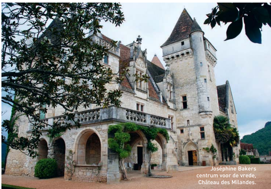
Joséphine Bakers centrum voor de vrede, Château des Milandes.

Die aankoop is niet alleen maar een gril van iemand met te veel geld. Ze is haar jeugd niet vergeten, en evenmin de veranderingen die ze als jong zwart kind heeft moeten ondergaan, en ze wil dat het dorp uitgroeit tot le village du monde . Dat dorp is niet alleen een soort pretpark, maar ook een ontmoetingsplaats, en de plek waar ze tien jongens en twee meisjes van verschillende nationaliteiten en godsdiensten zal adopteren als om de wereld te tonen wat →