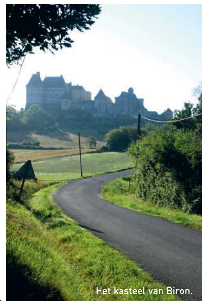
Het kasteel van Biron.

Kastelen en versterkingen liggen verspreid over het lieflijke landschap, als getuigen van het ruige verleden.