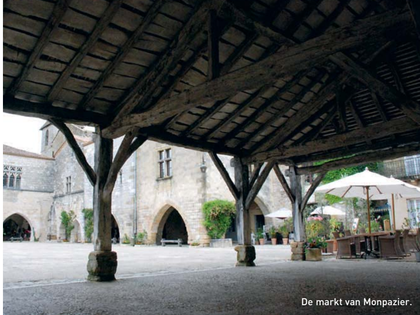
De markt van Monpazier.

mogelijk is met liefde, respect en goede wil. In 1957 zet ze er de eerste wereldconferentie tegen racisme op, zes jaar later zal ze in Washington naast Martin Luther King opstappen tegen racisme. Naar centen kijkt ze niet om, en ze moet enkele keren de draad van haar carrière weer opnemen om geld bijeen te sprokkelen voor het kasteel. In 1964 staat ze aan de rand van het bankroet, maar Brigitte Bardot trommelt enkele collega's op om haar te helpen. Dat lukt aanvankelijk wel maar het soelaas zal slechts van korte duur blijken, en vier jaar later wordt het domein aan een tiende van zijn prijs verkocht en staat Joséphine Baker op straat. Letterlijk. Het is het begin van het einde van een leven vol passie en menselijkheid dat in foto's, kostuums en ensceneringen te kijk staat.